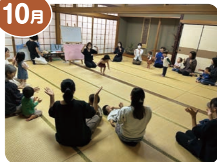
親子でいっしょに英語であそぼ