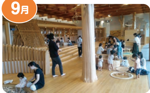
木のおもちゃで遊ぼうinぎふ木遊館