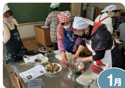
大根を使った料理づくり