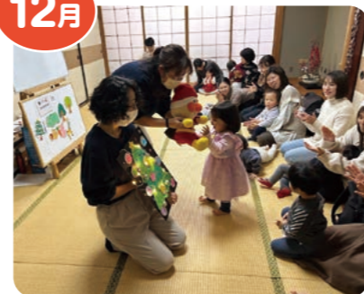
親子でいっしょに英語であそぼ Christmas